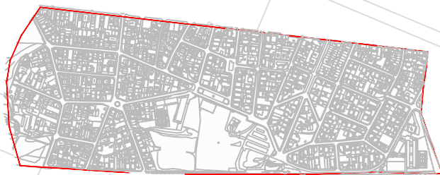
ESQUEMA DE LOCALITZACIÓ DE PLANTA