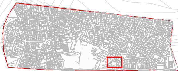
ESQUEMA DE LOCALITZACIÓ DE PLANTA