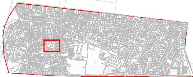
ESQUEMA DE LOCALITZACIÓ DE PLANTA