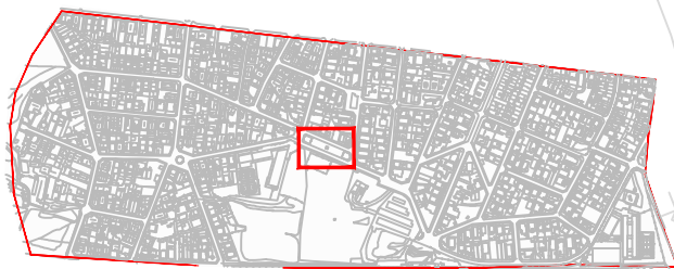
ESQUEMA DE LOCALITZACIÓ DE PLANTA