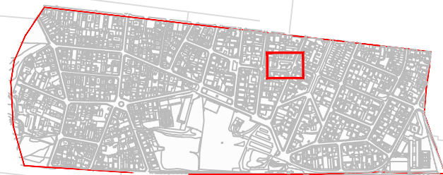
ESQUEMA DE LOCALITZACIÓ DE PLANTA